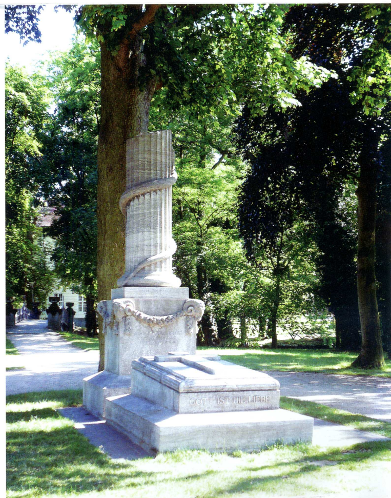
■ GRABMAL ADOLPH FRIEDRICH VI. AUF DER LIEBESINSEL

findet. Sein Tod im Jahre 1918 ist wie sein Leben von Mythen und Geheimnissen umwittert. Es wird vermutet, dass er sich selbst erschoss. Noch heute erinnert das Monument, welches der Herzog selbst entworfen hatte, an den letzten Regenten des Strelitzer Herzogshauses und sein tragisches Ende. Es ist zugleich der zu Stein gewordene Schlusspunkt der Geschichte des regierenden Hauses Mecklenburg-Strelitz und des Schlosses in Mirow als herzogliche Residenz.