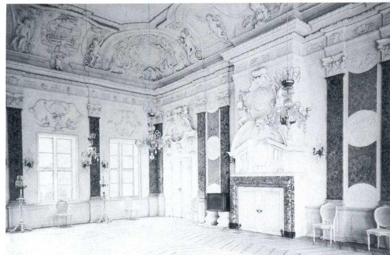
■ FESTSAAL IM OBERGESCHOSS

Nach dem ersten Weltkrieg und der Enteignung der herzoglichen Familie wurde der Bau museal genutzt. Später wurde eine Dienststelle der Wehrmacht eingerichtet. Bis 1978 war das Schloss Seniorenheim. Das Schlossensemble ist jetzt Eigentum des Landes Mecklenburg-Vorpommern und wird seit 1999 schrittweise wiederhergestellt, um es für die Öffentlichkeit zugänglich zu machen. Nachdem die anderen Residenzen des Herzogtums Mecklenburg-Strelitz verloren gingen oder ihrer Innenausstattung beraubt wurden, ist Mirow ein einzigartiges Zeugnis der Strelitzer Landeskultur. Aber auch über die regionalen Grenzen hinaus sind seine Kunstschatze in ihrer Geschlossenheit und Qualität von Bedeutung. Gegenwärtig werden die Innenräume umfassend restauriert.